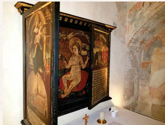
Maria mit dem Kinde lieb, uns allen Deinen Segen gib!

1954 wurde die seit dem späten 16. Jahrhundert umgestaltete Kreuzgangkapelle in den Zustand des 14. Jahrhunderts zurückrekonstruiert. Das kleine Flügelaltärchen des Wettinger Jesuskindes, welches vorher im Nordarm des Kreuzganges aufgestellt war, wurde nach seiner Restaurierung, um die schmucklose Ostwand der Kreuzgangkapelle nicht unbesetzt zu lassen, über dem Altar angebracht.