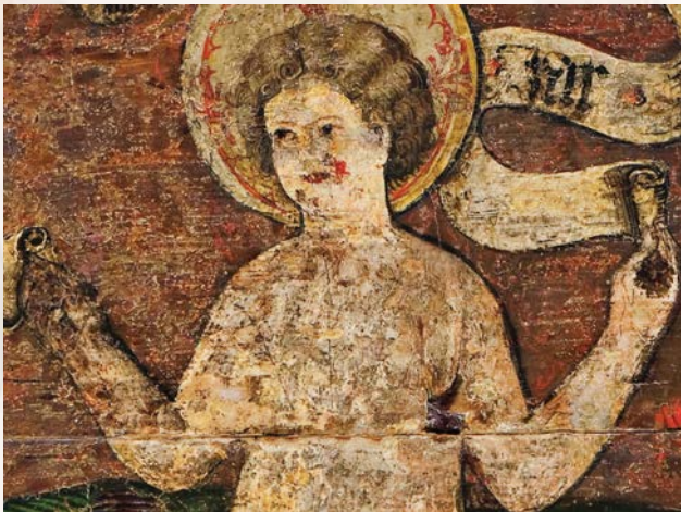
Eucharistisches Herz Jesu, hab' Mitleid mit uns!

«Es wird auch nicht leicht sein, die Kraft der Liebe zu erfassen, mit der Christus selbst sich uns zur geistigen Nahrung gab, wenn nicht in der besonderen Pflege der eucharistischen Herz-Jesu-Verehrung, die nach den Worten Unseres Vorgängers seligen Gedenkens Leos des XIII. erinnern soll <an die Tat der höchsten Liebe, in der unser Erlöser, alle Reichtümer seines Herzens hinopfernd, um bis an das Ende der Zeiten bei uns zu bleiben, das anbetungswürdige Sakrament der Eucharistie einsetzte>.»