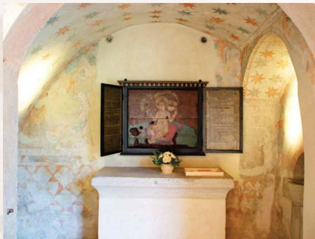
O liebes Wettinger Jesuskind! Bitte segne uns und unsere Familien. Jesus, ich vertraue auf Dich! Amen.

Das Bild könnte um 1450 (vielleicht unter Abt Rudolf Wüflinger) für das Kloster Wettingen geschaffen worden sein und dort einen Raum des Abtes geschmückt haben. Das Tafelbild besteht aus zwei gleich grossen Holzbrettern. Das Bild misst 86 x 71 cm und zeigt in seiner künstlerischen Manier noch Einflüsse des sogenannten Schönen Stils, der um 1400 und bis ins vorgerückte 15. Jahrhundert nördlich der Alpen weit verbreitet war und sich durch seine weichen Umrisslinien auszeichnet. Eine Künstlersignatur fehlt auf dem Bild, ebenso eine Archivquelle, die den Autor nennen würde. Die Malerwerkstatt könnte sich im Kloster selbst oder in Baden oder Basel befunden haben (zu Basel hatte Abt Wüflinger besondere Beziehungen). Dass ein Mönch das Bild gefertigt hätte, ist nicht auszuschliessen, aber eher unwahrscheinlich.